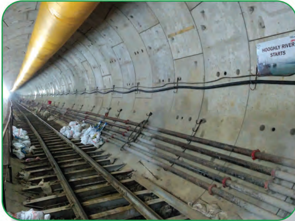
Tunneling complete below River Hooghly