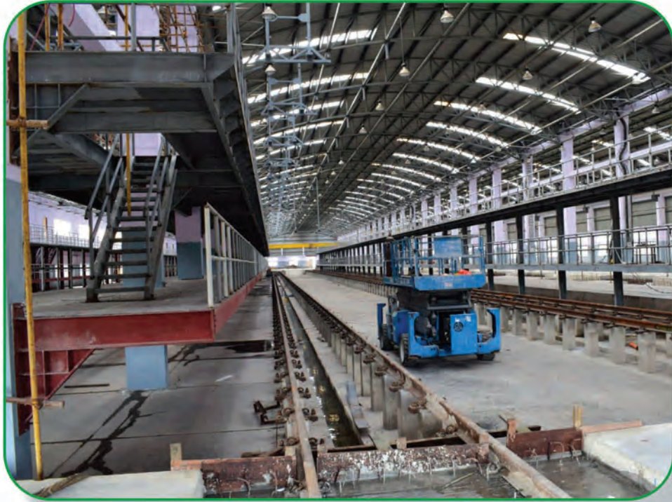
Substantially finished workshop in Central Park Depot