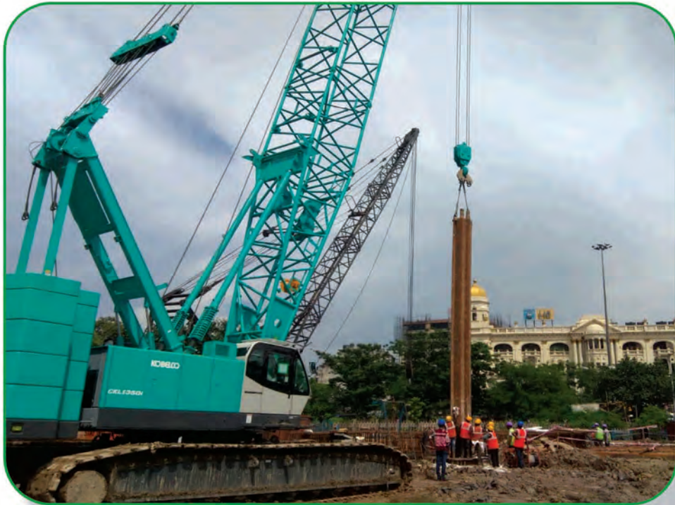
Diaphragm Wall started at Esplanade